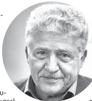
ΤΟΥ ΘΟΔΩΡΟΥ ΟΡΔΟΥΜΠΟΖΑΝΗ

Βανδαλισμένοι σταθμοί με ανεκτίμητη αρχιτεκτονική αξία, συνθέτουν την εικόνα εγκατάλειψης και παρακμής στο μεγαλύτερο μέρος του σιδηροδρομικού