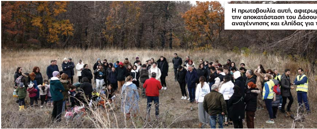
Η πρωτοβουλία αυτή, αφιερωμένη στη βιωματική εκπαίδευση και την αποκατάσταση του Δάσους της Δαδιάς, αποτέλεσε σύμβολο αναγέννησης και ελπίδας για την περιοχή