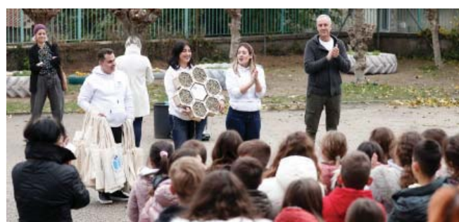
Καθ' όλη τη διάρκεια της εβδομάδας, η επικεφαλής Προγραμμάτων & Επικοινωνίας του Ιδρύματος Χατζηγάκη και Ελισάβετ Χατζηγάκη, πραγματοποίησε επισκέψεις και δράσεις σε σχολεία του Σουφλίου