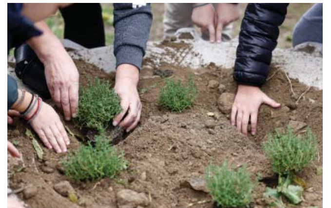
Η εικόνα μικρών παιδιών να φτεύουν δέντρα σε μια τριπλά καμένη περιοχή αποτελεί φωτεινό σύμβολο ελπίδας και αναγέννησης για το μέλλον του δάσους και της κοινότητας